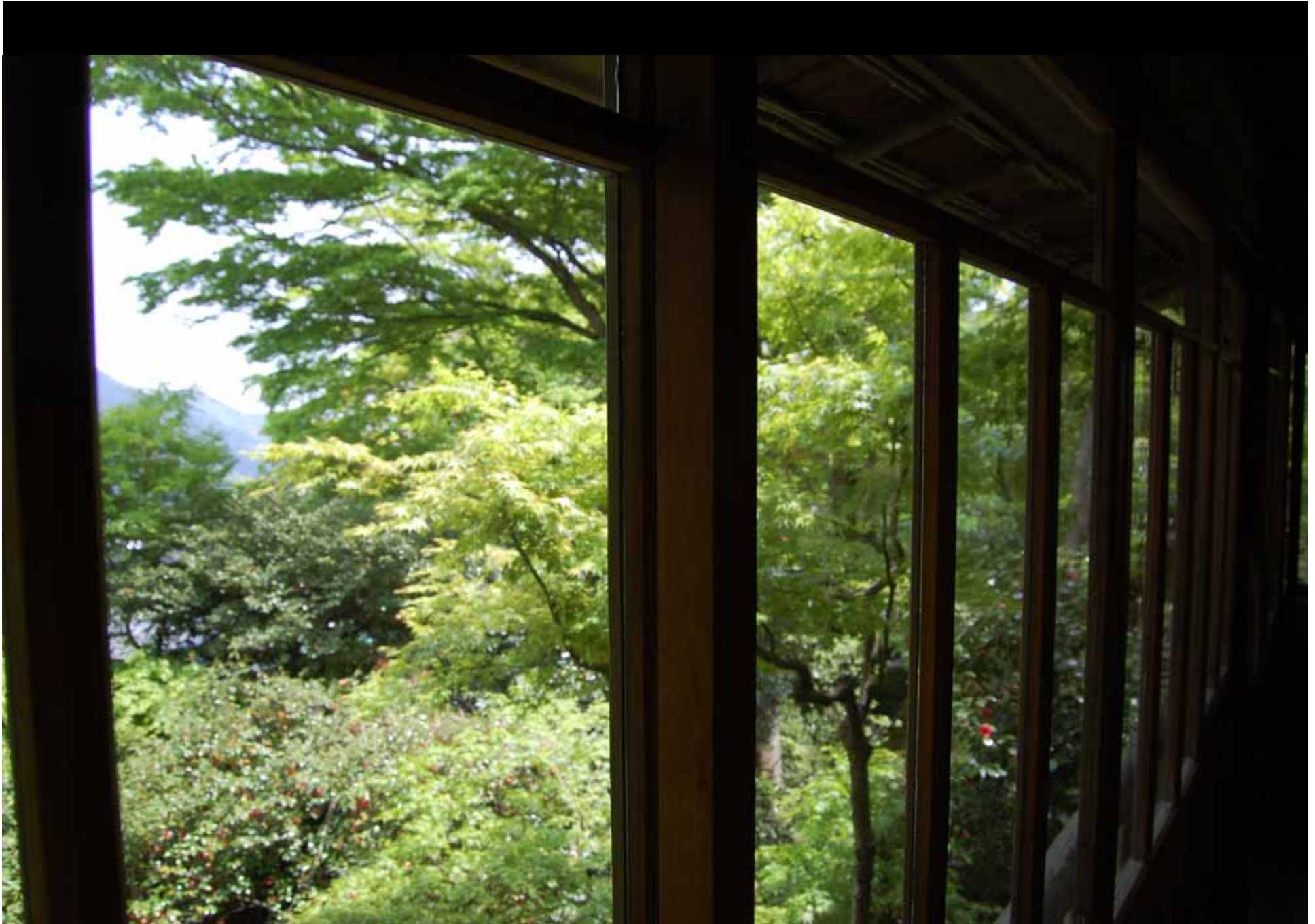
Ausblick vom Teehaus