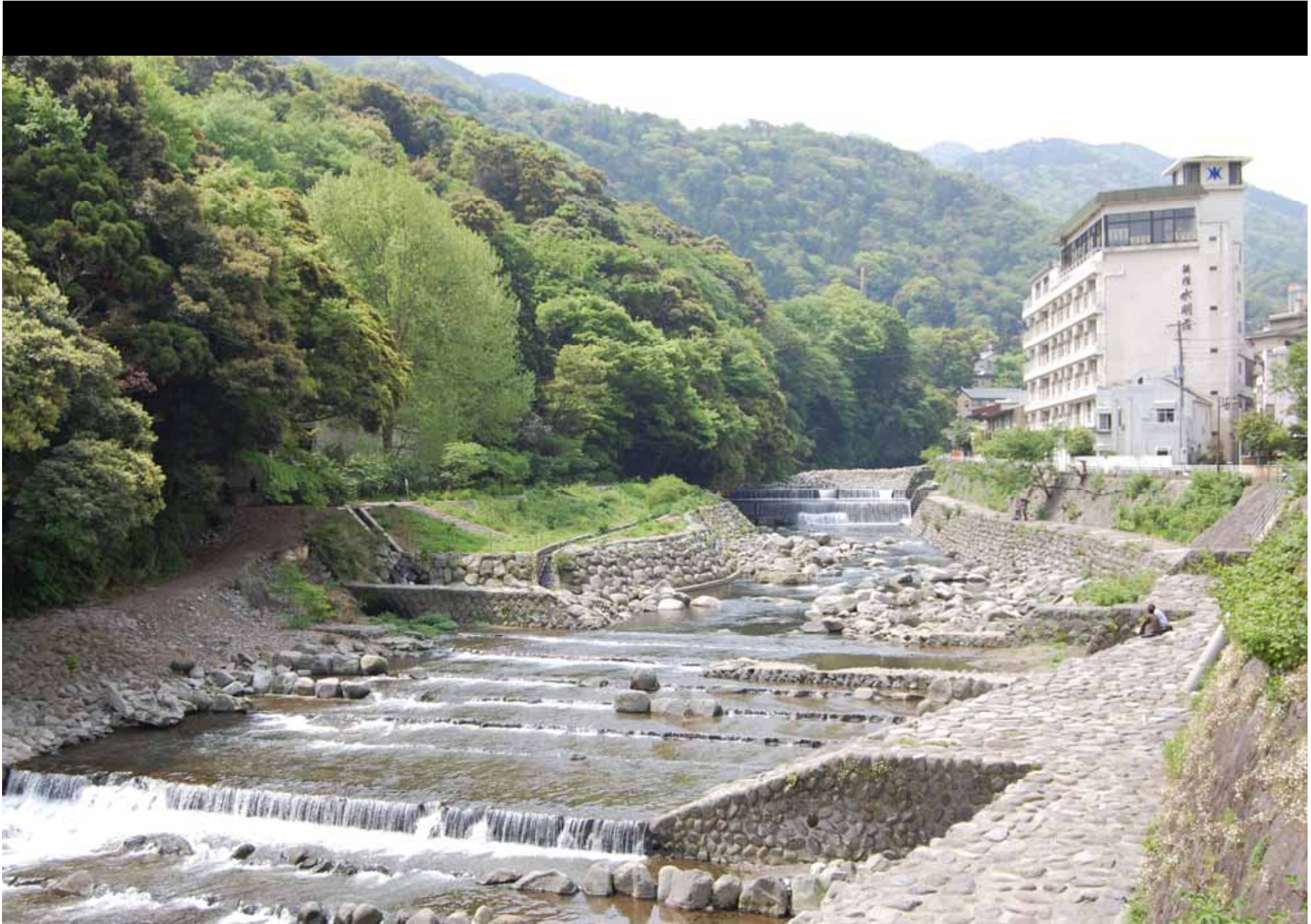
Fluss in Hakone