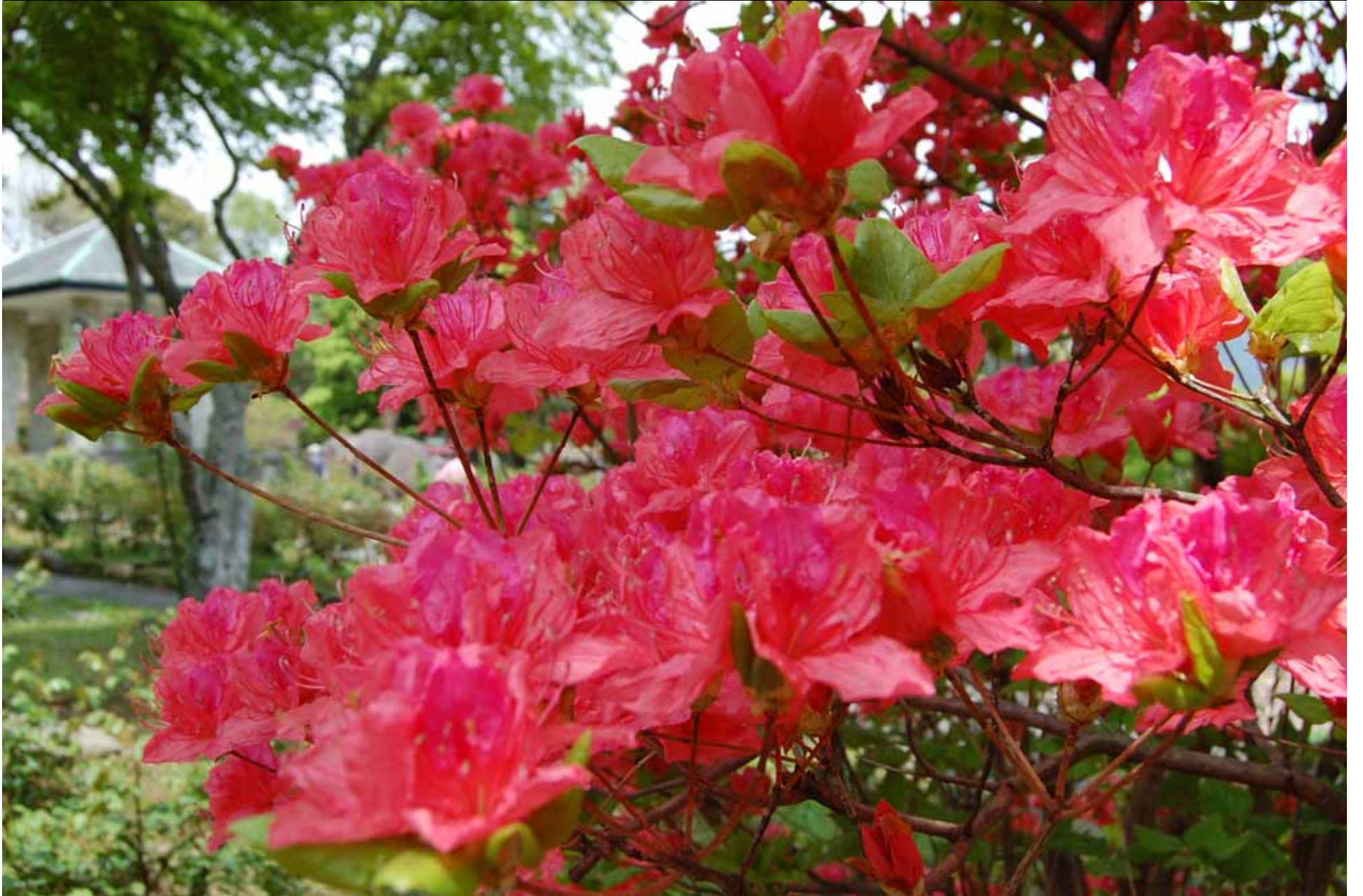
Ein paar Aufnahmen aus einem Park in Hakone