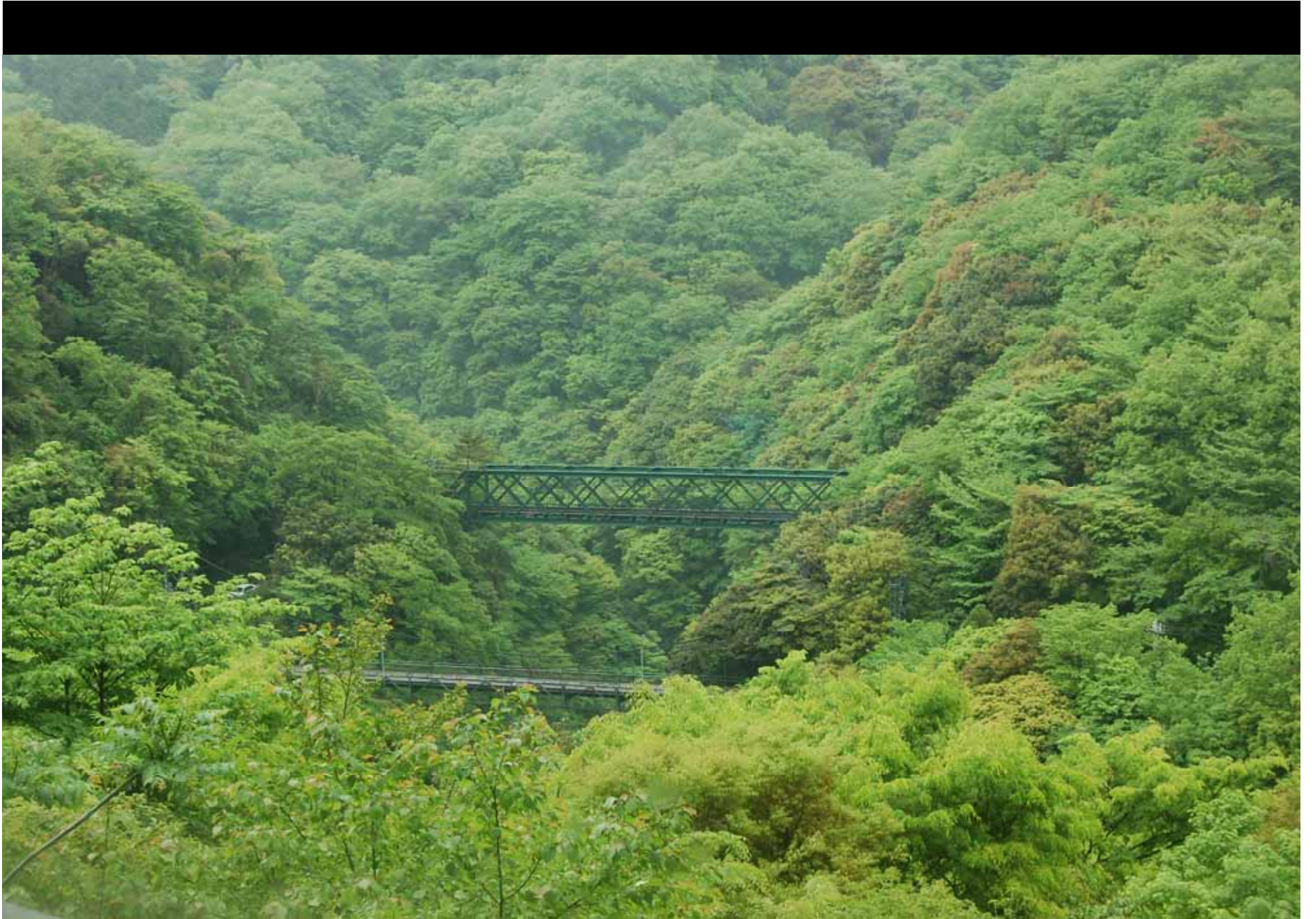
Natur in Hakone