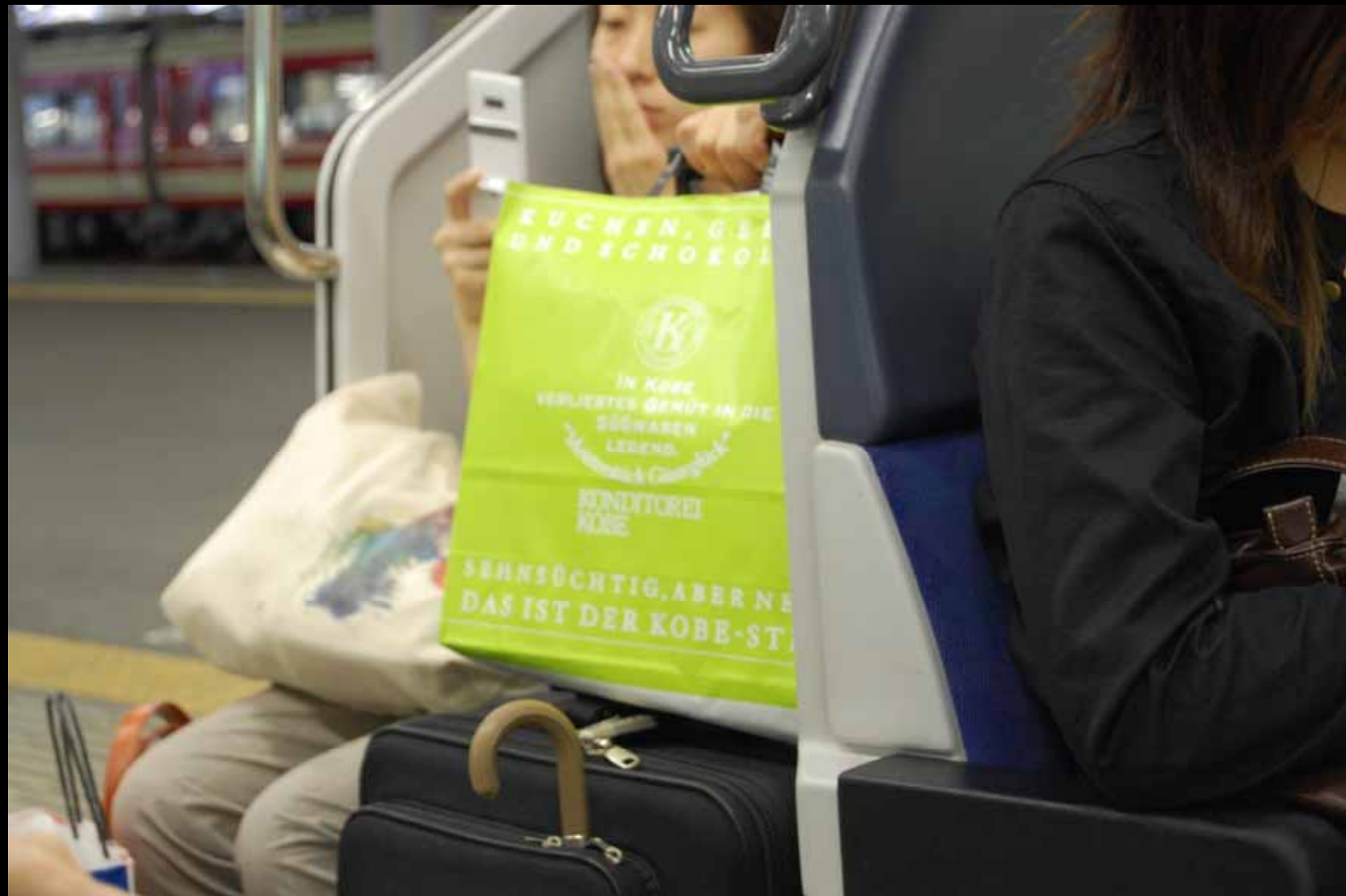
Einkaufstüte mit lustiger deutscher Beschriftung (Konditorei Kobe: Sehnsüchtig, aber neu. Das ist der Kobe-Stil. Aha. : )