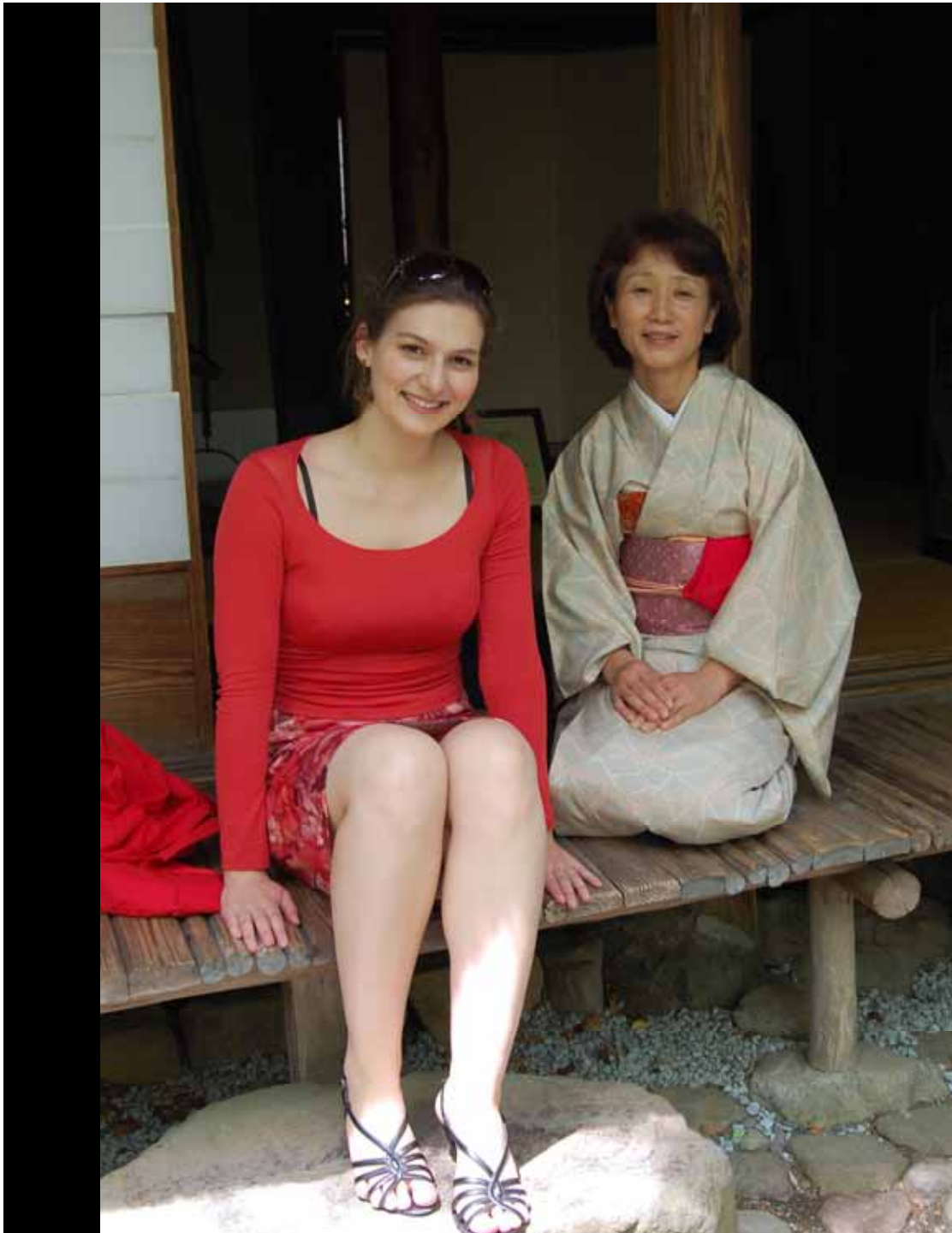
Im Teehaus mit Bedienung im Kimono