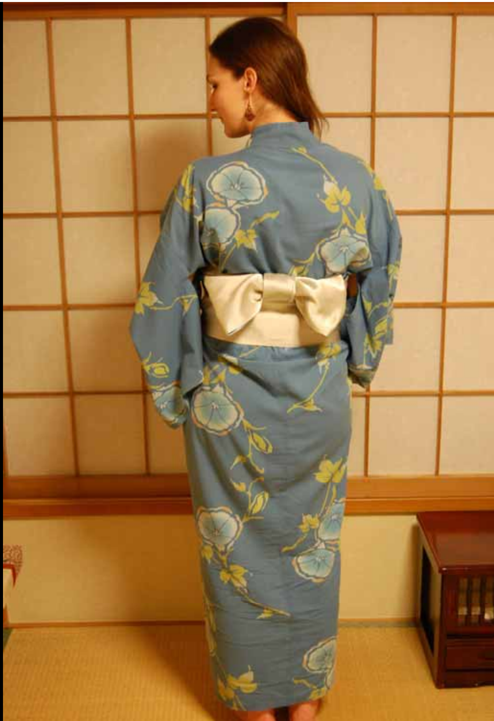
Ich in Yukata