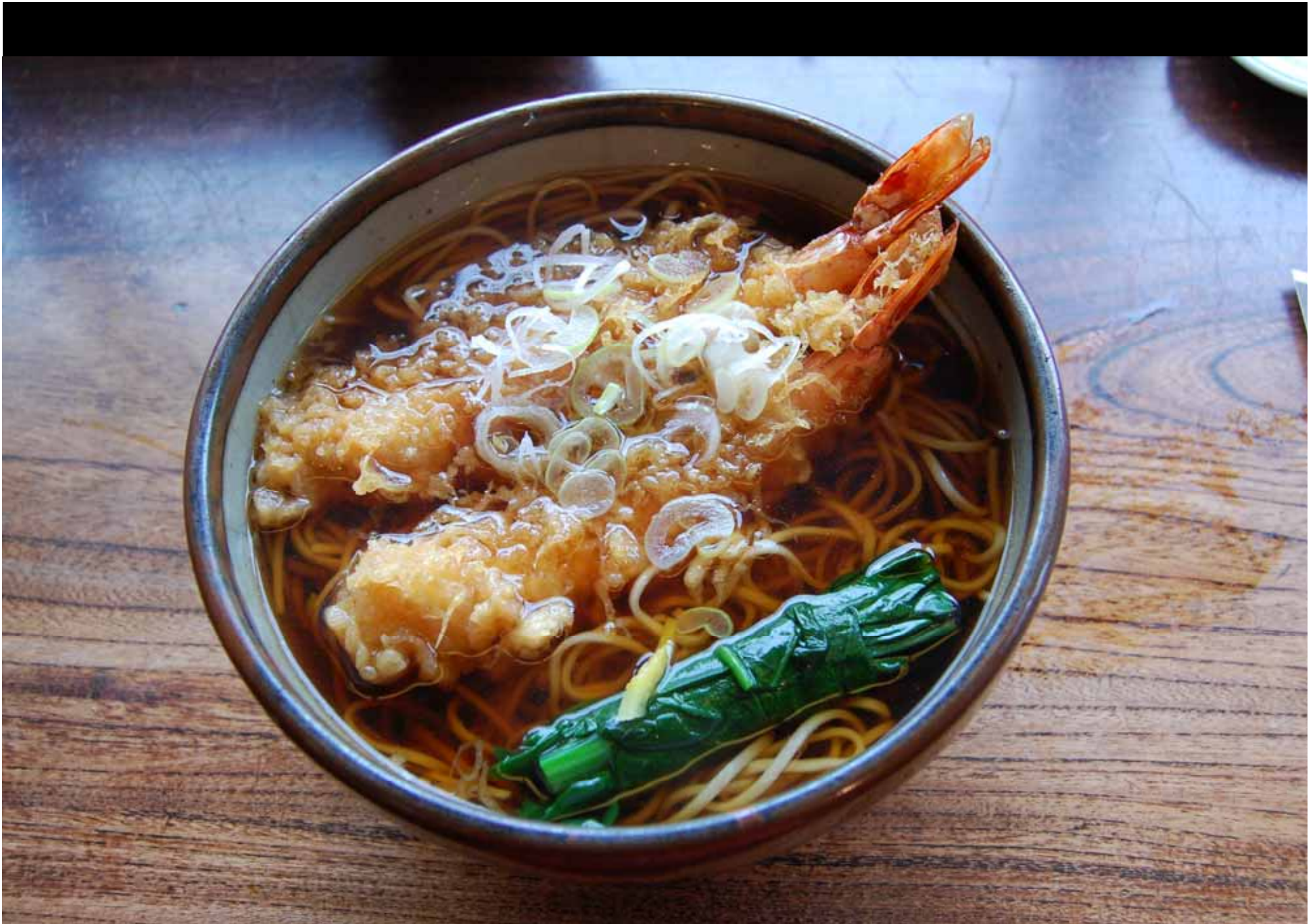
Mein Mittagessen (Nudeln mit frittierten Garnelen)