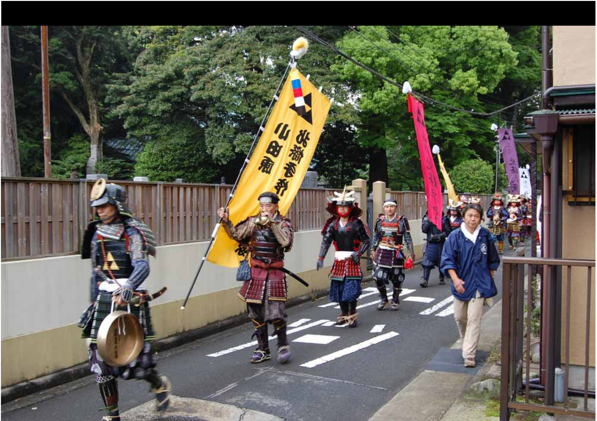
Umzug mit traditionellen Samuraiuniformen